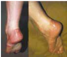
Abb.1 Trophische Veränderungen der Haut bei schwerer Polyneuropathie

primär die Axone oder die Myelinscheiden geschädigt sind. Während ein Verlust der Axone zu einem motorischen oder sensiblen Defizit führt, gehen Schädigungen der Markscheiden mit „Fehlstörungen“ wie Missempfindungen und Schmerzen einher. Letztere sind ein typisches Phänomen bei Mitbeteiligung kleiner markarmer Fasern und kennzeichnen das Bild der sogenannten „Small fiber Neuropathie“. Eine Schädigung sog. vegetativer Nerven kann zu einer vermehrten Schweißneigung, Fehlregulationen von Hautgefäßen mit Hautrötung, aber auch zu einer Atrophie [Geweberückbildung] der Schweißdrüsen und sonstiger Hautanhangsgebilde führen. Auch eine Verengung der Hautgefäße des betreffenden Areals ist möglich. Die Haut selber kann ebenfalls atrophieren und anfälliger für Verletzungen und Infektionen werden (vgl. Abb.1)