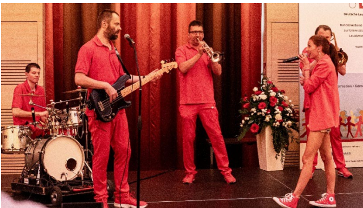
Die Band „Kölsche Adler“ sorgte für Stimmung.