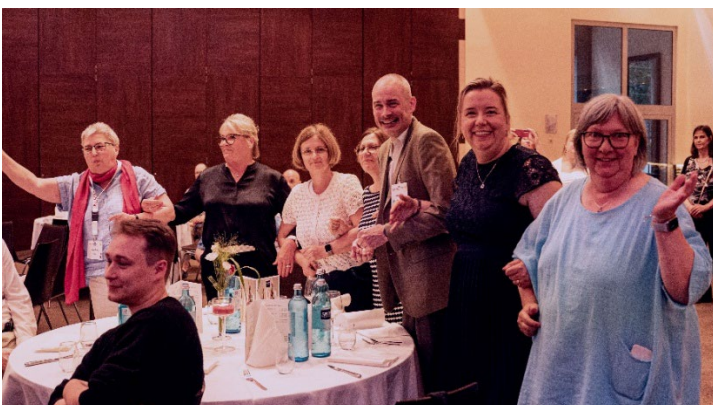
Schunkeln und Mitsingen erwünscht