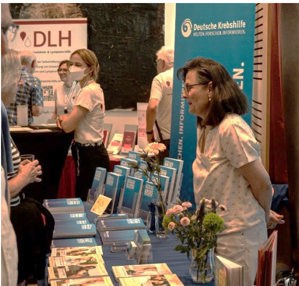
Auch am der Infostand der Deutschen Krebshilfe gab es einen intensiven Austausch.

Der persönliche Austausch mit Gleichbetroffenen ist für viele Teilnehmer das Herzstück des Kongresses. Weil Blutkrebserkrankungen ausgesprochen vielschichtig sind und sich in Verlauf und Behandlung zum Teil erheblich unterscheiden, ist es nicht immer leicht, passende Gesprächspartner zu finden. Wer mochte, konnte mit einem farbigen Klebepunkt auf dem Namensschild die eigene Diagnose sichtbar machen – eine einfache, aber wirkungsvolle Möglichkeit, um mit Gleichbetroffenen ins Gespräch zu kommen. Dafür gab es zahlreiche Gelegenheiten: an den Infoständen, in den Pausen, bei den Kontaktbörsen im Anschluss an die krankheitsspezifischen Workshops oder am „Zeitstrahl“, auf dem die Besucher den Zeitpunkt ihrer Diagnose mit einem Farbpunkt markieren konnten.