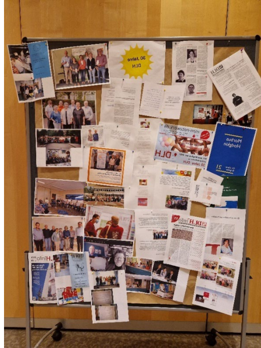
Die Wandzeitung „30 Jahre DLH“ lud zum Stöbern ein.